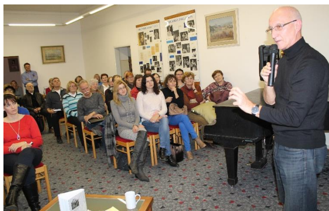
Kód 7 prezentácia najnovšieho románu Jozefa Banáša (12. 12. 2016)