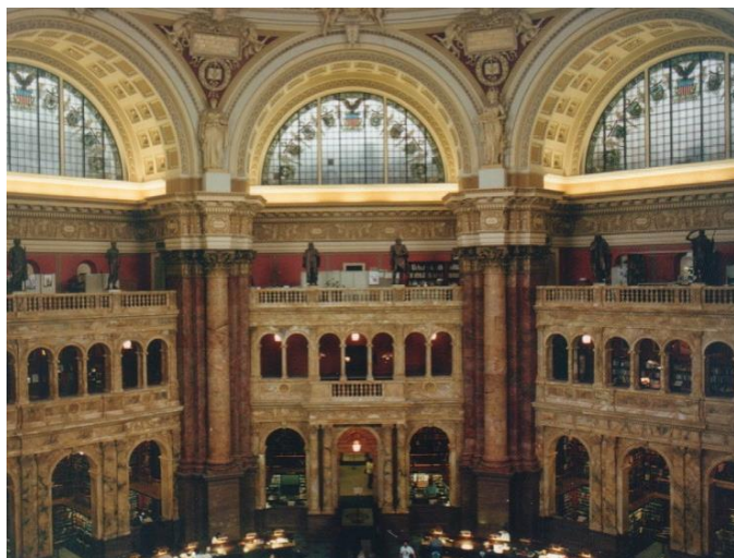
(Čtenář, ročník 68, č. 11/2016, s. 419), Foto: Wikimedia

Spojené štáty majú energickú a rôznorodú knižničnú komunitu, ktorá má veľký vplyv na vývoj spoločnosti. Americké knižnice sú vysoko dôveryhodné, bezpečné a inkluzívne miesta. Spojené štáty disponujú cca 120 000 knižnicami na 320 miliónov obyvateľov. Verejné knižnice hrajú významnú komunitnú úlohu – slúžia spoločnostiam všetkých veľkostí a typov a americká verejnosť ich vníma ako demokratické organizácie so slobodným prístupom k informáciám. Spoločnosť uznáva, že knižnice vnášajú kvalitu do informačného ekosystému, ktorý je teraz celkom preplnený neprehľadnými on-line alternatívami. Nové služby menia životy ľudí a sú zdrojom blahobytu, na druhej strane sa mnoho knižníc stále stretáva s dopadmi ekonomickej krízy z roku 2008 (znížené rozpočty a počty knihovníkov, obmedzenie služieb). Knižnice hľadajú nové argumenty, ktorými by presvedčili zriaďovateľov o svojej prospešnosti.