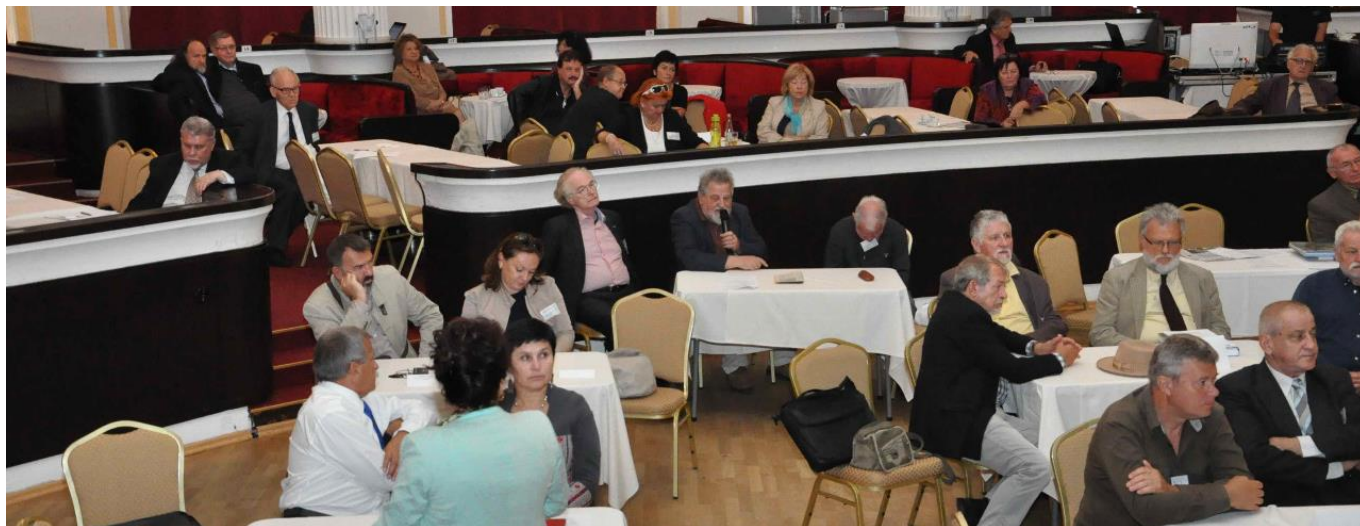
V popredí zahraniční účastníci Kongresu slovenských spisovateľov s medzinárodnou účasťou v Trenčianskych Tepliciach.

Úprimne a z celého srdca vás všetkých pozdravujem, želim kongresu tvorivého a konštruktívneho ducha s presvedčením, že budete hovoriť o slobode, krásne a dobre. V dnešných časoch nástojčivo potrebujeme humanistického človeka, pretože racionálny či politický človek nás nezachráni, nezachráni nás ani nenávisť, zachráni nás iba láska.