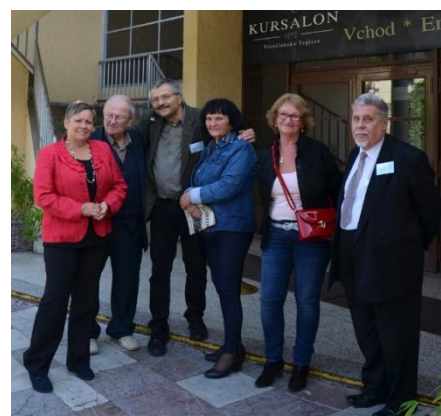
Účastníci kongresu (22.-23. 9. 2016) ►